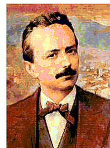
Tovini. Per il primo appuntamento