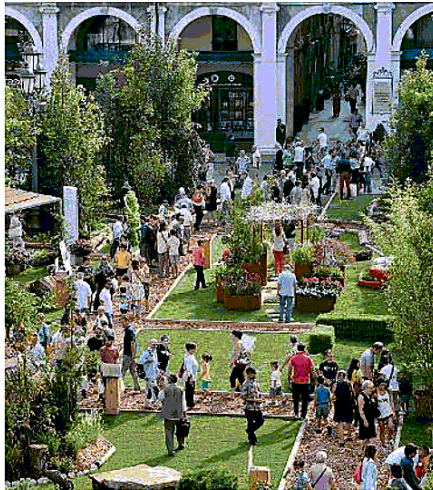
Tavolozza. Tutte le sfumature di verde nell'edizione 2016